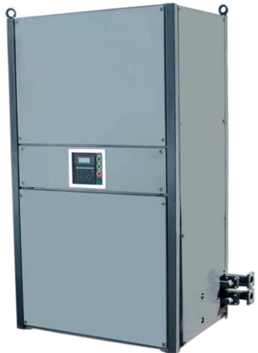
Рис. 3. Кондиционер КА 60/6С

Конструкция кондиционеров постоянно совершенствуется с учетом опыта эксплуатации на АЭС. Первые партии поставленных на АЭС кондиционеров комплектовались герметичными поршневыми компрессорами. По данным эксплуатации на Хмельницкой и Южно-Украинской АЭС средняя наработка этих кондиционеров на отказ, рассчитанная по ДСТУ 3004-95, превышает 20 000 часов при доверительной вероятности 0,96. Новое поколение этой серии кондиционеров комплектуются герметичными спиральными компрессорами, которые имеют более высокие эксплуатационные показатели надежности по сравнению с компрессорами поршневого типа. Это обусловлено прежде всего малым числом движущихся частей у спирального компрессора, нечувствительностью его к опасным режимам работы (влажный пуск, унос масла, утечка хладагента, избыточный перегрев и другие) и способностью к моментальной разгрузке спирального блока при попадании в полость