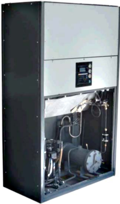
Рис. 1. Кондиционер КА 30/4С

по «мокрому» термометру на входе в кондиционер, как наиболее полно отображающая различные сочетания температуры и влажности воздуха, соответствующие одному и тому же значению энтальпий воздуха на входе в кондиционер. Характеристика базовой модели кондиционера КА 60/6С в виде зависимости холодопроизводительности от указанных параметров Q_0 = f(t_{м1}, t_{в1}, G_w) представлена на рис. 2. Анализ экспериментальных исследований кондиционера КА 60/6С с водяным охлаждением конденсатора показывает, что его холодопроизводительность на номинальном режиме (1'-2'-3') соответствует заявленной в технических условиях на поставку. При повышении температуры охлаждающей конденсатор воды t_{в1} до 33 °С, сохранении номинальных значений тепловой нагрузки на воздухоохладитель и расхода охлаждающей воды G_w , холодопроизводительность кондиционера снижается на 3...4 % (1'-а-а').